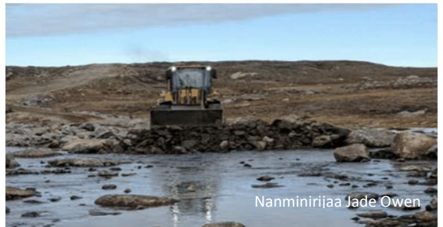
Nanminirijaa Jade Owen

Akiharniq: Utuqqak apqut ikaarviuvagaat kuugaq imaatut 2,000 miitat qunmut kuukkamut hivuangit. Ujararjuaq hanajauhimajuq (inuum ujaraliuqhimaajaat) kuugarmunngauhimajaat naiglinahuarlugulu imaq hitiningat taimaa hangujut ikaarianganit. Nunamiuqatigiit nalunaiqhimajaat Iqalukpik ihuuluutauiqtut aallannguqallianingit, taimaa aulpaqahimajaat ingilravingit uvannat tarjumit halumajumik imarmut.