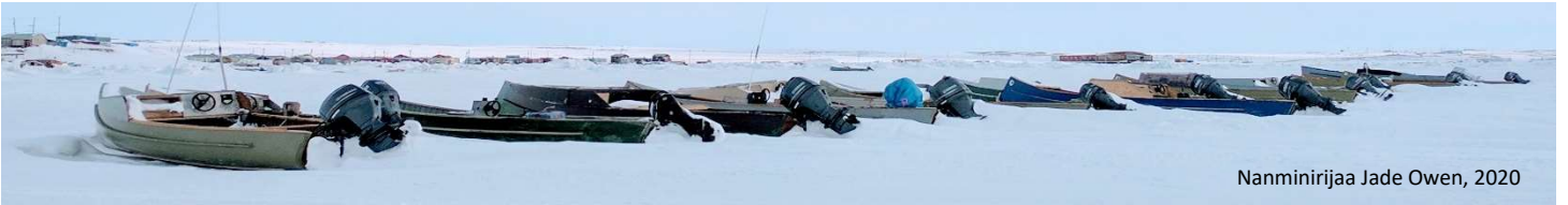
Nanminirijaa Jade Owen, 2020

Taryuq Hinaagut Akihautingit: Nunalingni pulaaqhimavlutik, hamna Taryup Hinaagut Utiqtittiningit Nunavut (CRN) havaqatigiiktut tuhaumakhaaqhimajut ihuilluutinnik angiklijuummiqhuni umiaqtuqtut hanguhimajut uvani pitquhirnikkut anguniarviujut inikhangit. Nunaliit ikpiguhuktut ilauhimannigittut ihumaliuqtunut ilagijaa umiaqtuqtunut atuagait unalu umiarjuq ikaarvingit tamarmik ihuilluutajuq Inuit inikhautikhangit pijunnautingit. Inikhangit: Clear Seas parnautigijangit uvaptingnut havaakhanut tiliuqhimagialik nauhimallugillu nalunaitkutikhanut nivinngaqtakhat unalu amihuujut uqauhilit makpirakhaq kangiqhittiaqhimagiama naunaittiaqhimallugillu nunaliit